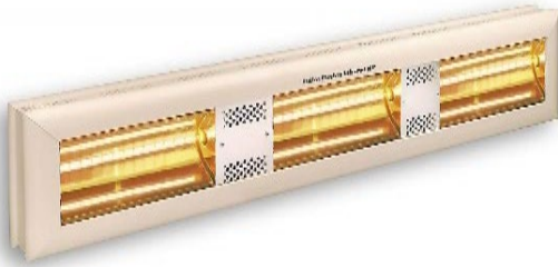
HP 3 Horizontal