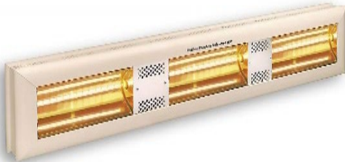
HP 3 Horizontal